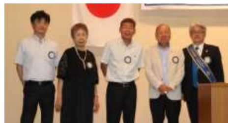
地区出向者委嘱状伝達