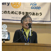
国分寺みんなの居場所づくり連絡会